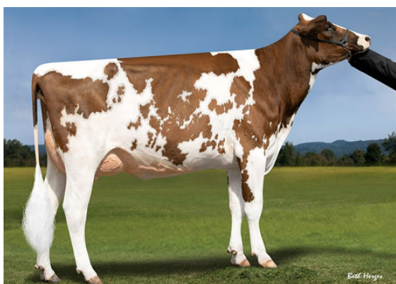
HOLLENDALE JEDI CRIM-RED FIFTH DAM