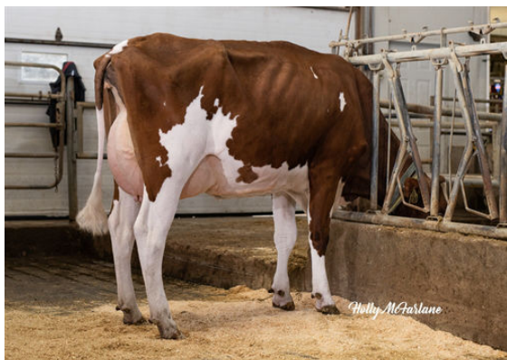
PROGENESIS GTEE CABERNET RED FOURTH DAM